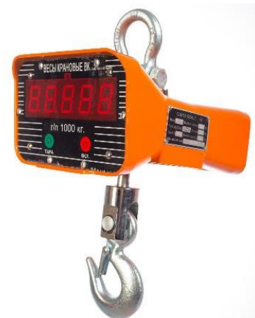
Рисунок 2. Общий вид весов крановых OCS

Общий вид весов представлен на рисунке 2.